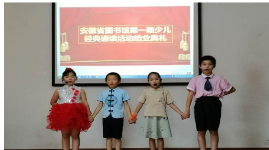
少儿假期主题阅读