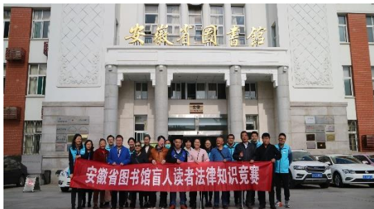
残障人士读书文化日