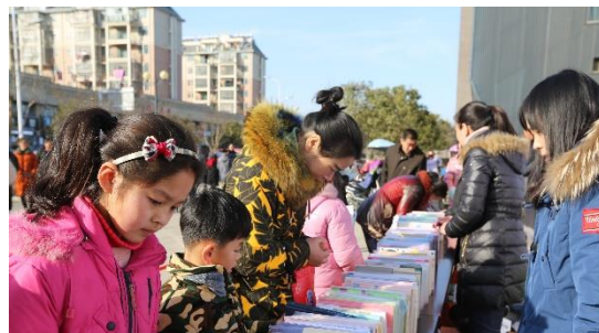
优秀书刊漂流阅读