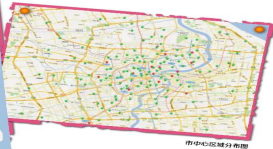
市中心区域分布图

截至 2018 年底，上海市中心图书馆“一卡通”服务体系成员包括总馆 1 个，市级公共分馆 1 个，区（县）公共分馆 21 家，街道（乡镇）服务点 216 家，高校分馆 1 家，专业分馆 5 家，其他服务点 12 家，总计 257 家机构，服务网点数达到 347 个。