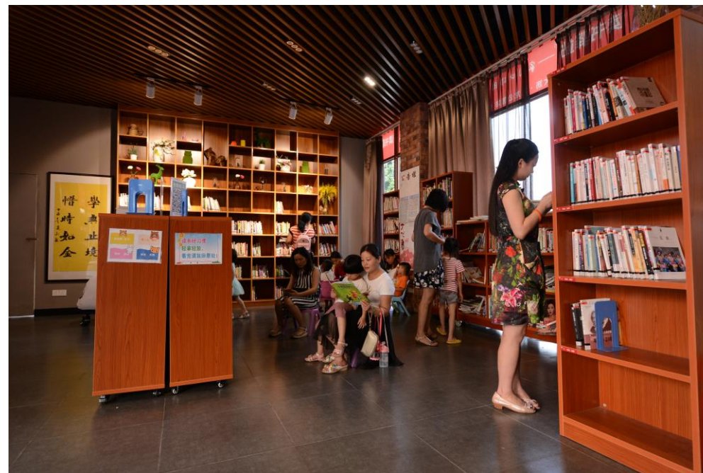
大沥九龙公园读书驿站