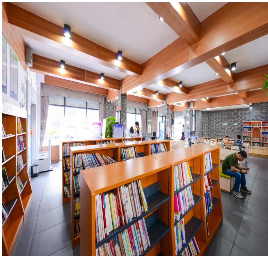
村居驿站，由农家书屋改建而成（里水·河村社区站）